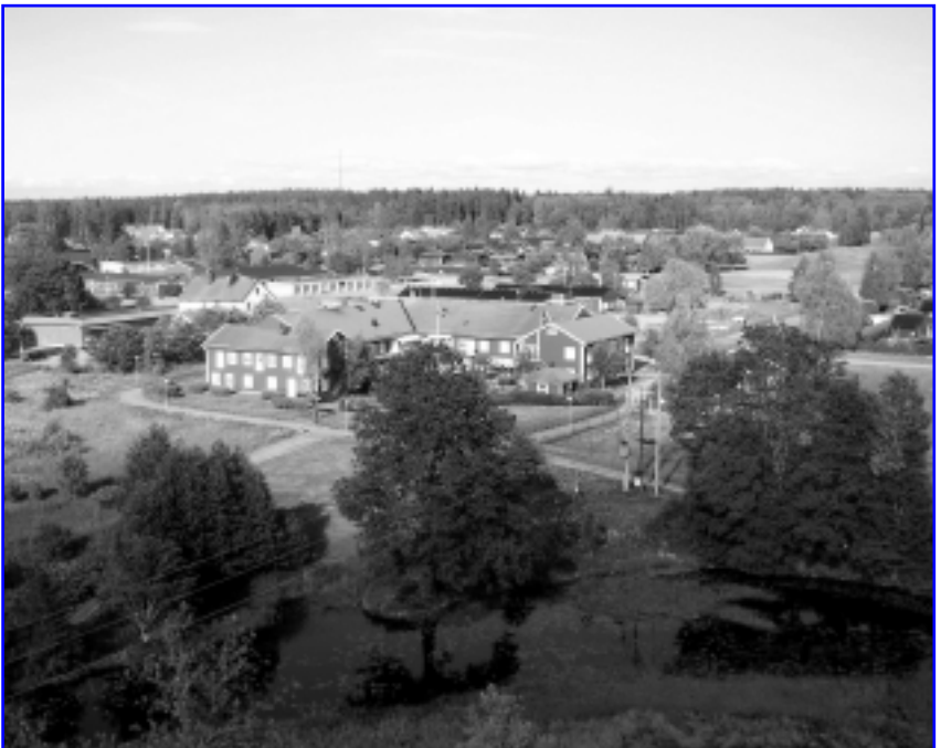
Vattholma från ovan.